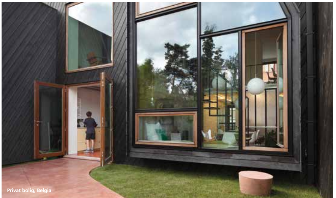
Privat bolig, Belgia